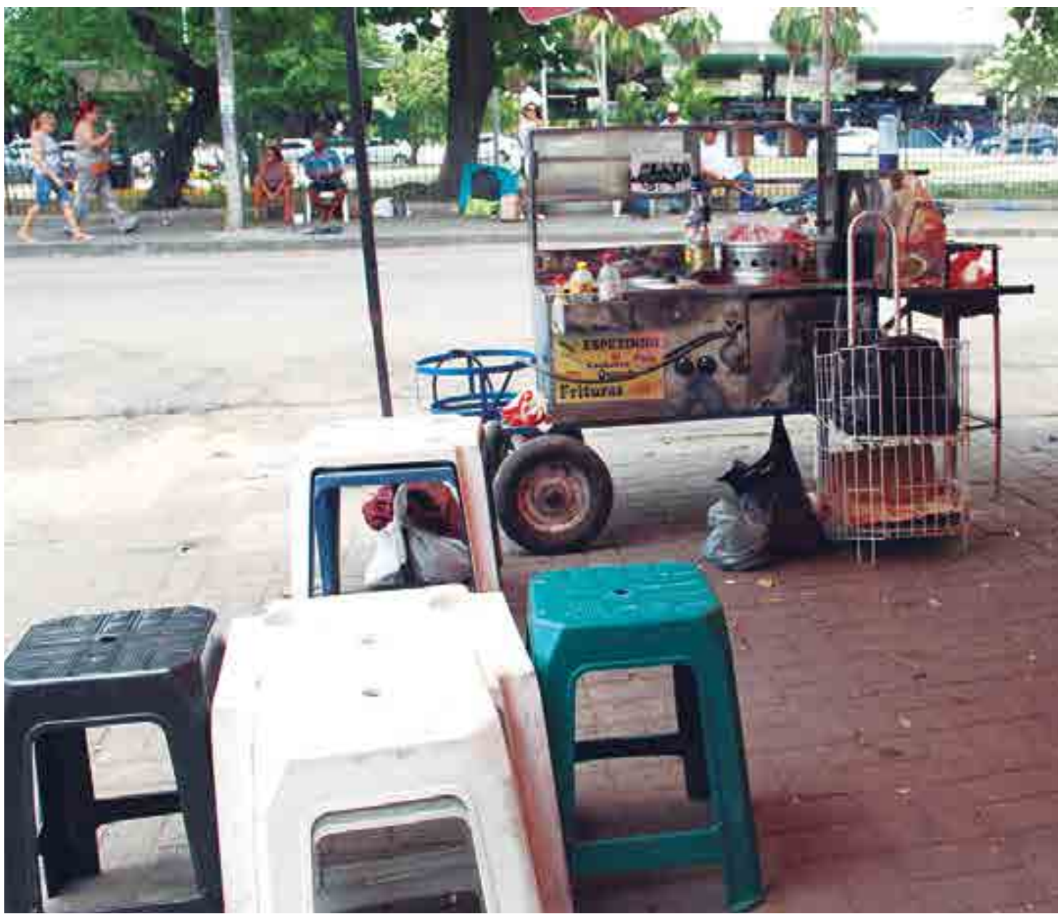
Sedurb está oferecendo 190 vagas para ambulantes trabalharem no Folia de Rua e no Carnaval 2020; número é inferior ao do ano passado

As inscrições, que se iniciam nesta segunda-feira, serão realizadas na Secretaria de Desenvolvimento Urbano (Sedurb). Para se inscrever é necessário comparecer ao