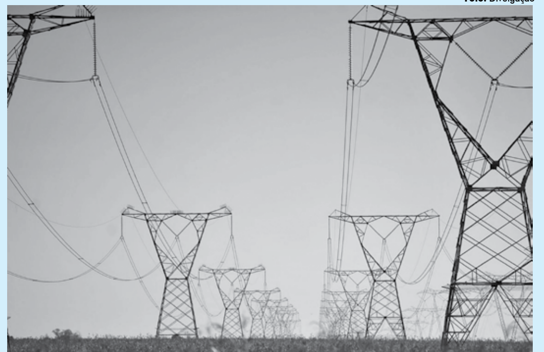
Agência Nacional de Energia Elétrica (Aneel) atendeu a uma demanda da Confederação da Agricultura