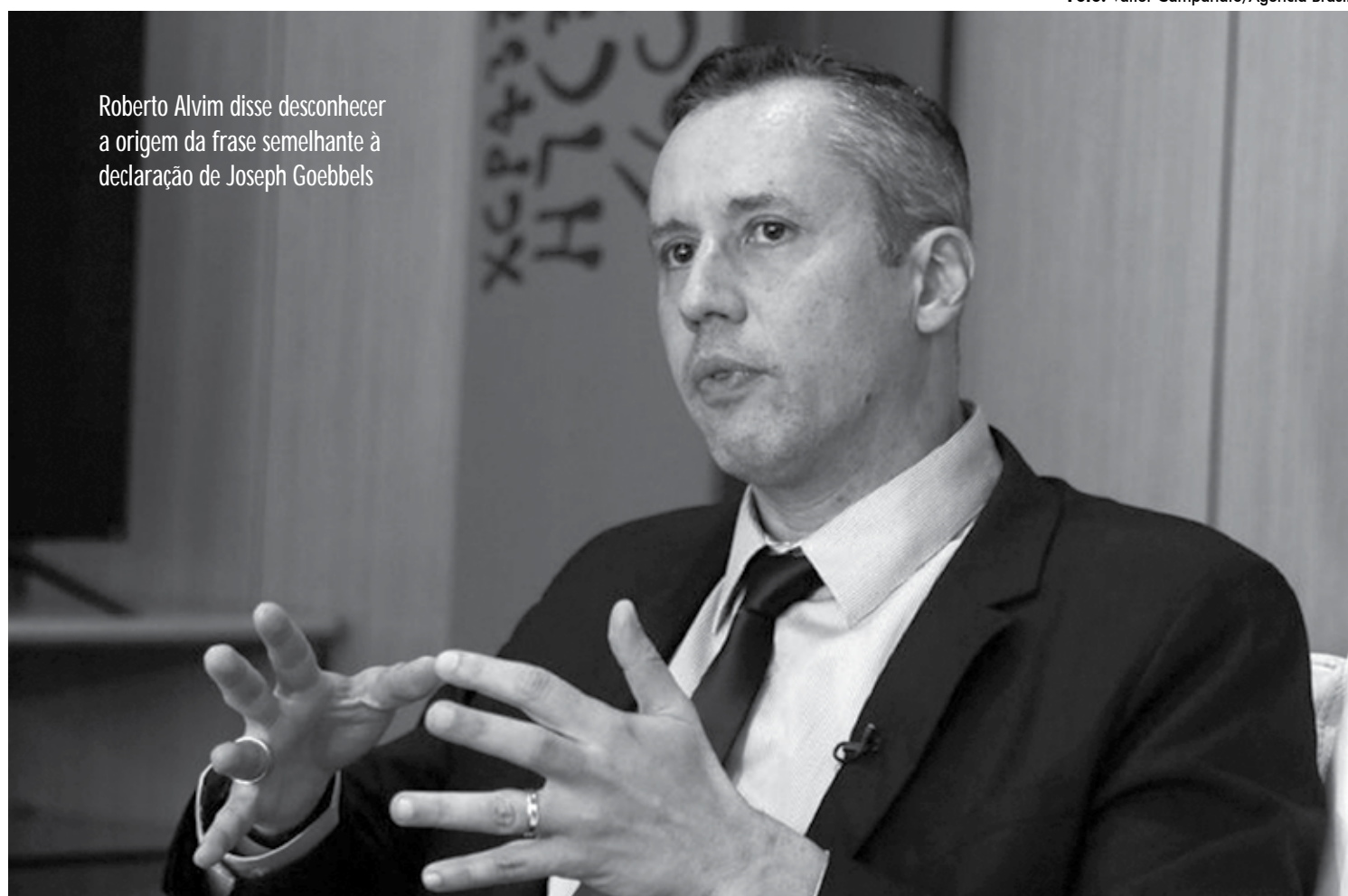
Roberto Alvim disse desconhecer a origem da frase semelhante à declaração de Joseph Goebbels

No vídeo, o secretário fala sobre o lançamento do Prêmio Nacional das Artes e sobre o que seria o ideal artístico para a pasta