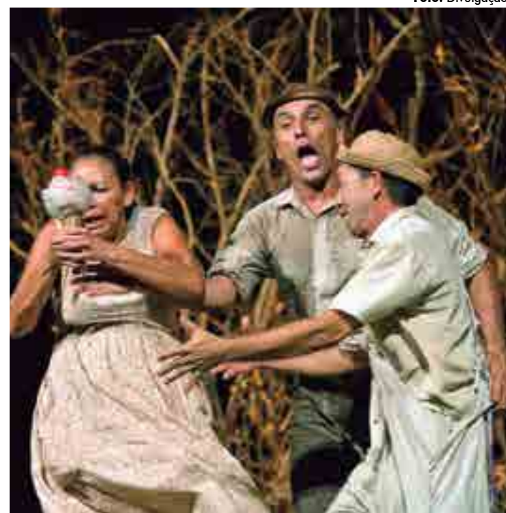
Escrito por Altimar Pimentel, 'Como Nasce...' mergulha no Brasil rural

A propósito, o teatro foi fundado em 1987 e só passou por uma grande intervenção no ano passado, quando o Governo do Estado o reabriu em outubro, após reforma e ampliação, num investimento orçado em mais de R$ 4,9 milhões.