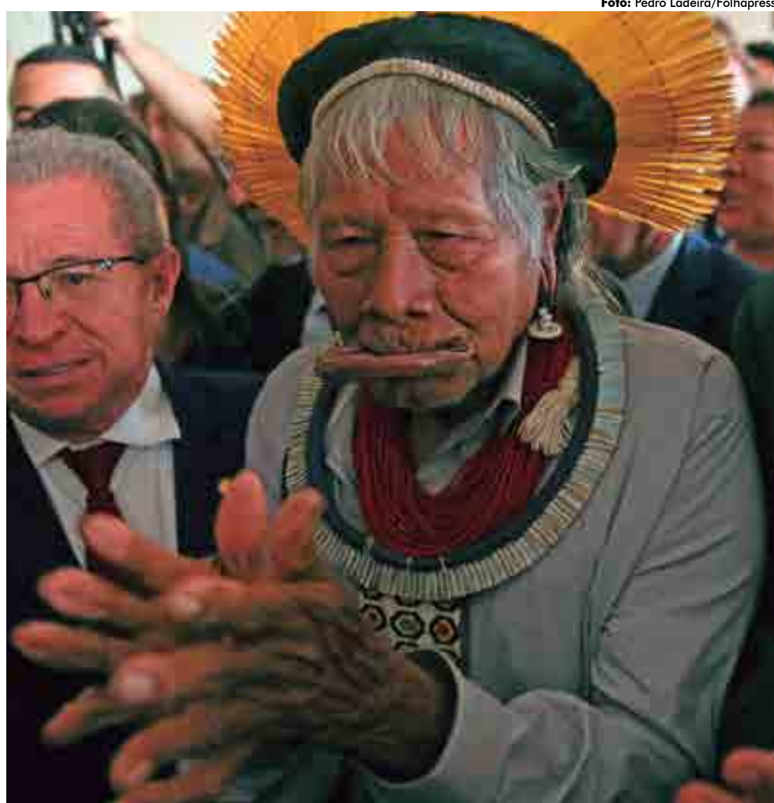
Raoni durante manifestação realizada em setembro do ano passado na Câmara dos Deputados, em Brasília