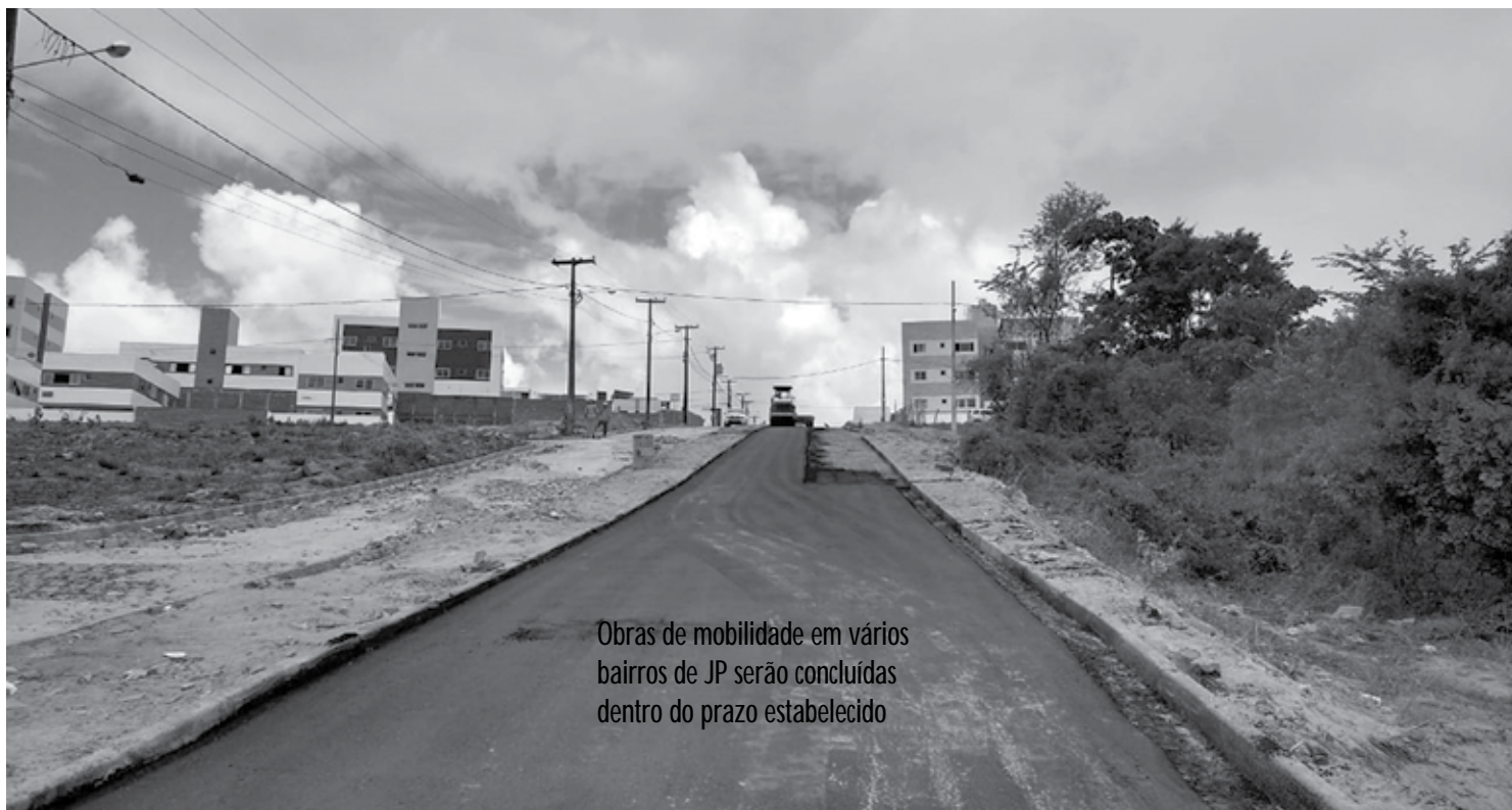
Obras de mobilidade em vários bairros de JP serão concluídas dentro do prazo estabelecido

O outro ponto visitado foi a ligação do Colinas do Sul com o bairro do Geisel, onde será construído um aterro no Rio Cuiá, com 7 metros de altura, que vai consumir cerca de 60 mil metros cúbicos de material. O gerente de Obras, Aluísio Lucena, explicou que nesta ligação, além das vias em fase de pavimentação, o aterro será iniciado em poucos dias com a liberação da área pela Sudema.