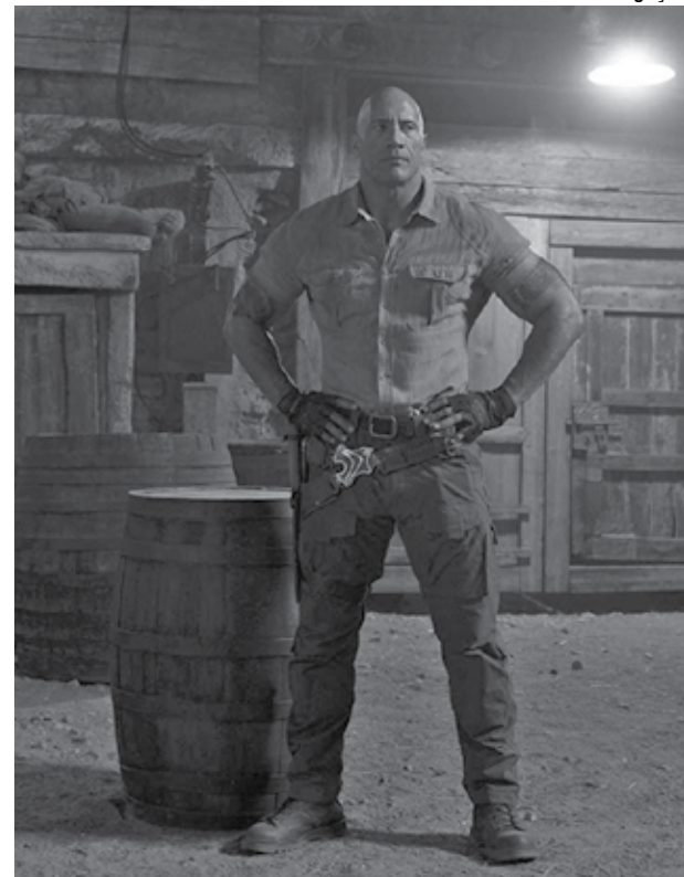
Dwayne Johnson estrela 'Jumanji': nome quente do filme de ação