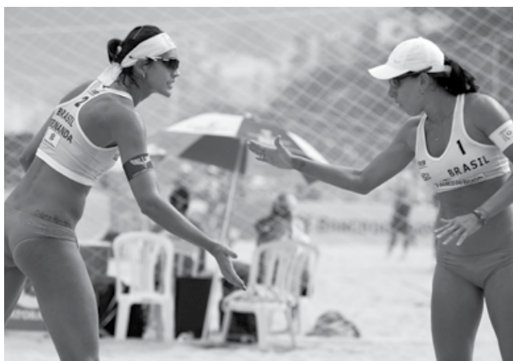
O Circuito este ano vai começar com muitas mudanças de times em relação a 2019